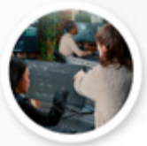
Día del ingeniero de sistemas