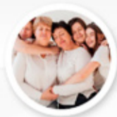
Día de la mujer