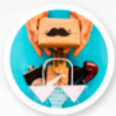
Día del hombre